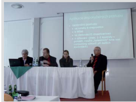
Obrázek 2. Předsednictvo konference