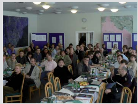
Obrázek 1. Pohled do sálu

specializací vyhlásí MZ na návrh odborných společností a ČLK. Je řešena i otázka akreditací a financování. Tento systém je předmětem novelizace, která by měla proběhnout od roku 2008 ve dvou stupních, není tedy dosud platný.